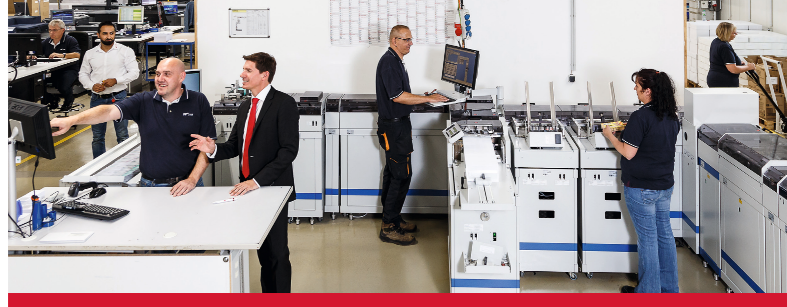
FP IAB kategorisiert und klassifiziert den Posteingang für Flightright: zusätzlicher Zeitgewinn durch die Automatisierung einstmals manueller Tätigkeiten.