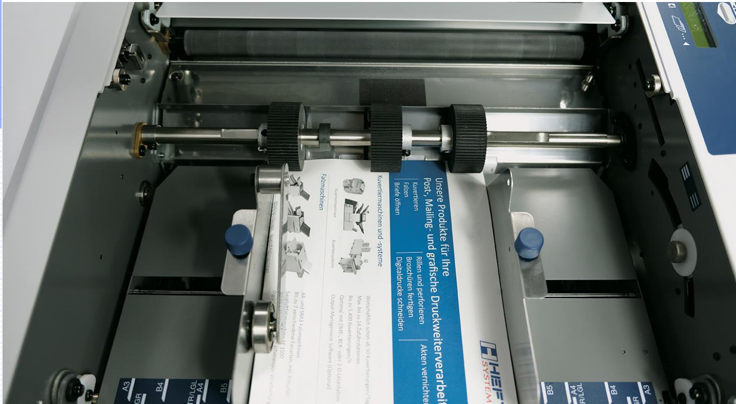
TF MEGA-M plus

Versetzbare Einzugswalze (links) für einen optimalen Einzug auch für Kreuzfalz gut geeignet.