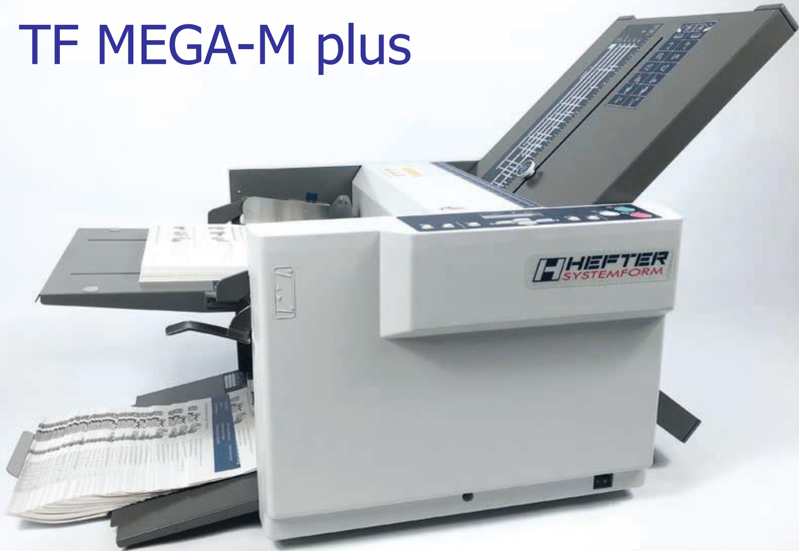
TF MEGA-M plus