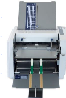
TF MEGA-M plus